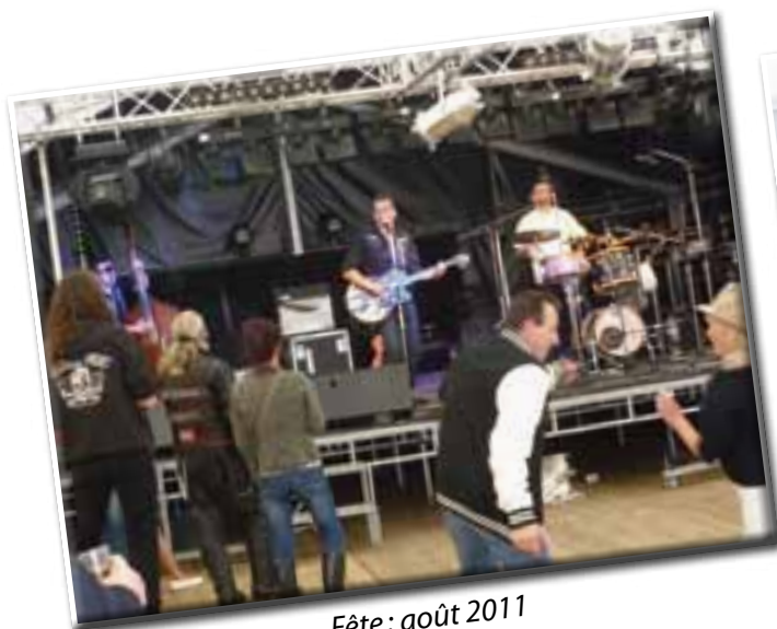
Fête: août 2011