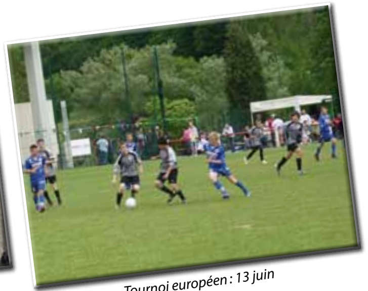
Tournoi européen: 13 juin