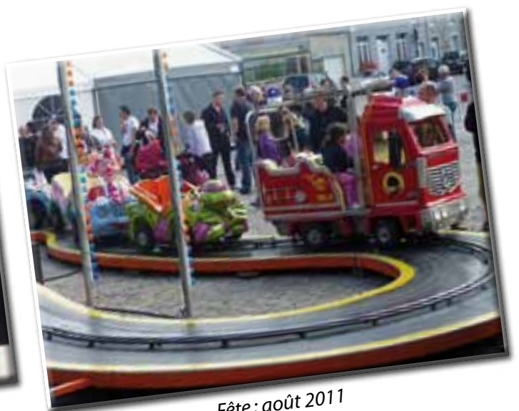
Fête: août 2011