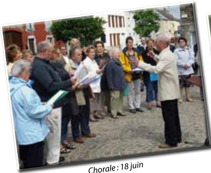
Chorale: 18 juin